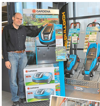
Große Auswahl: BTL hat sein Gartenzubehör-Sortiment kräftig erweitert.

Ein großes Thema in diesem Jahr ist der automatische Garten. Denn, so Huth: „Jeder möchte einen schönen Garten mit einem hohen Freizeitwert. Doch oft fehlt es an der Zeit, um sich darum zu kümmern.“ Ein Helfer kann neben der automatischen Gartenbewässerung zum Beispiel auch der Rasenmähroboter sein, der selbstständig und von Sensoren geleitet die Rasenpflege übernimmt. Für alle, die sich für den Roboter interessieren: BTL ist heute und morgen, 12. und 13. April, mit einem Stand auf dem Lengericher Frühjahrsmarkt vertreten und erklärt auf dem Bodelschwingh-Platz die Funktionsweise des eigenständig arbeitenden Geräts.